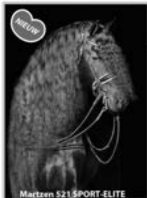
Martzen 521 SPORT-ELITE

Beant (Hessel x Tjalle) 1.71m. "Imposante hengst met veel ras en beweging"