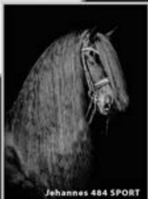
Jehannes 484 SPORT

Yme (Tjalle x Berie) 1.65m. "Excelleert met talent en uitstraling"