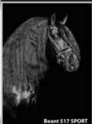
Beant 517 SPORT

Wilbout (Thorben x Dooske) 1.69m. "Laagverwant, chique, formaat en karakter"