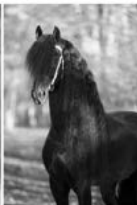
Markus 491 Sport (Maurits x Onne)