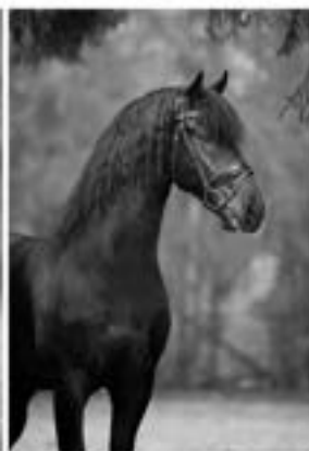
Wardy 509 Sport (Hette x Goffert)