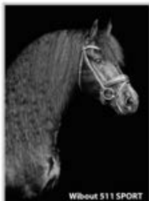
Wilbout 511 SPORT

Jehannes (Tjalle x Depke) 1.69m. "Top veerverv van een nieuw tijdperk"