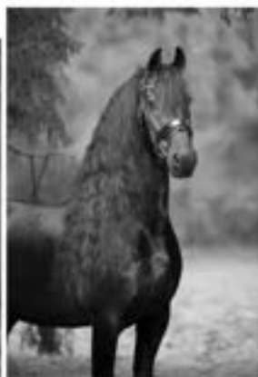
Fonger 478 Sport (Olgert x Doeke)