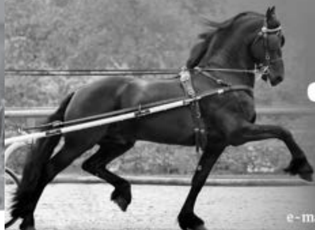
Faust 523 AAA

U BENT VAN HARTE WELKOM BIJ de nieuwe heuvel