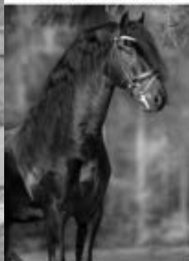
Menne 496 Sport (Norbert x Beart)