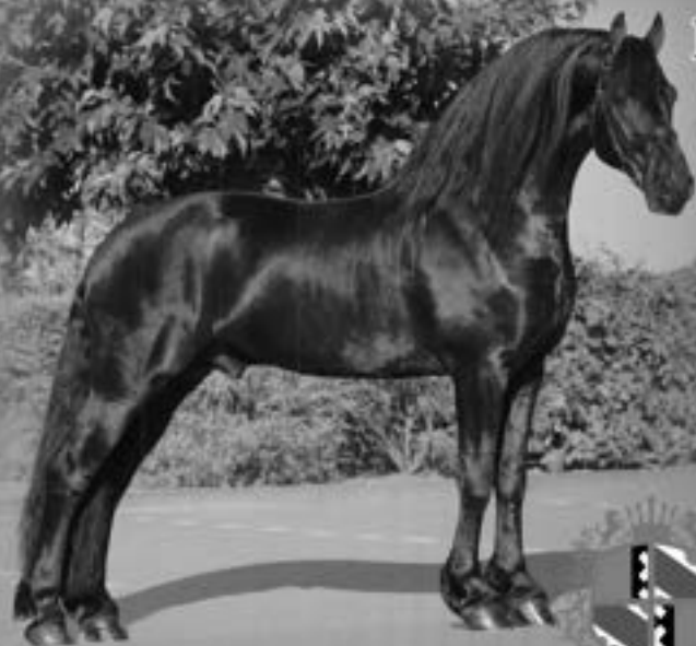
Tjebbe 500 Sport AAA