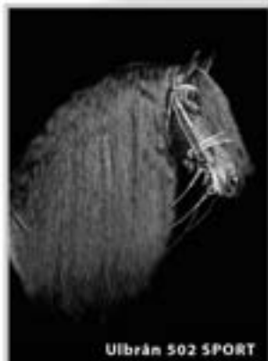
Ulbrán 502 SPORT

Ulbrán (Reinder x Jakob) 1.69m. "Overtuigd met fenomenale nakomelingen"