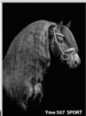
Yme 507 SPORT

Ulbrán (Reinder x Jakob) 1.69m. "Overtuigd met fenomenale nakomelingen"